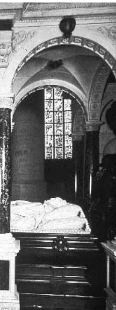
Crypt William of Orange

There is no certainty about three coffins present there. Near the resting-places of William of Orange and Louise de Coligny, there are three coffins of children whose identities have not been established.