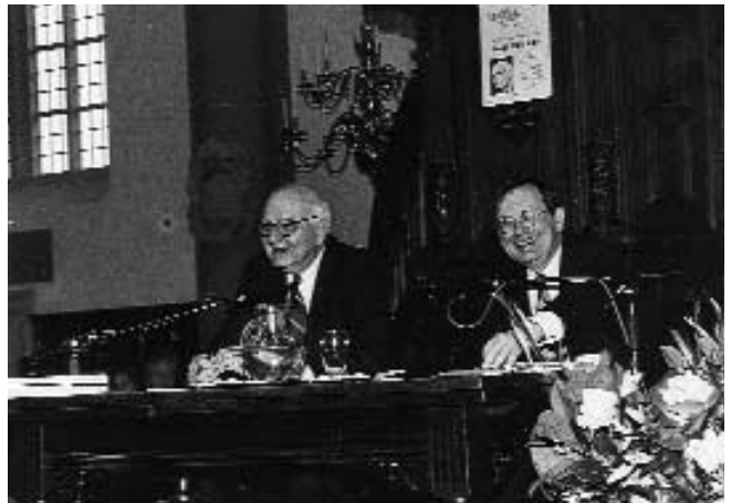
American Focus: lecture by former American Bank President Mr. Paul Volcker (left) and Dutch Bank President Mr. Wellink

Contributions for the summer-issue of Voices from Holland should be in by June 30th . Comments on the winter-issue and suggestions for future issues are welcomed, and so are reports and announcements on local Dutch-American folklore and exchange activities. Letters to the editor and contributions for the readers corner (preferably no longer than 300 words) can be sent to: