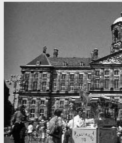
Het Koninklijk Paleis op de Dam in Amsterdam