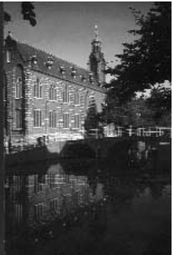
“University of Leiden: fifth in Europe”