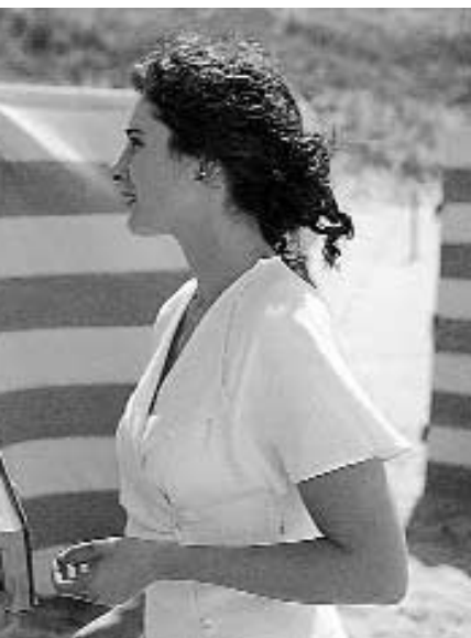
Scene from "Character"

The Netherlands secured their second Oscar