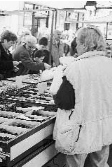
Selling licorice at Utrecht market