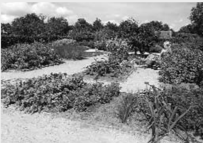
'De Kruidhof', Buitenpost

Sonnema draagt 1000 gulden bij in de kosten van de speciale border. Als tegenprestatie biedt 'De Kruidhof' op de kruidenzolder van de distilleerderij informatie over de kruiden, die in berenburg worden verwerkt. Voorts gaan beide partijen op promotiegebied samenwerken.