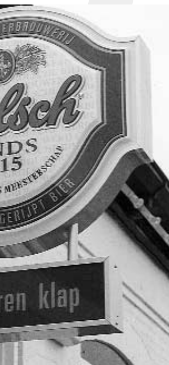
Sign of Dutch bar with Grolsch on draught

The options that were set against each other longest were the concentration of new buildings in Enschede or Groenlo. In the end, 'De Grote Plooi' was chosen because of its proximity to, and its connections with, the highway A35. Besides, the steadily increasing shortage on the labor-market played a part, as well as the location on the periphery of a big town with its wide-ranging facilities - from a university to a theater. Commuting traffic was also taken into account: the fact is that seventy per cent of 950 employees live in Enschede or its immediate surroundings.