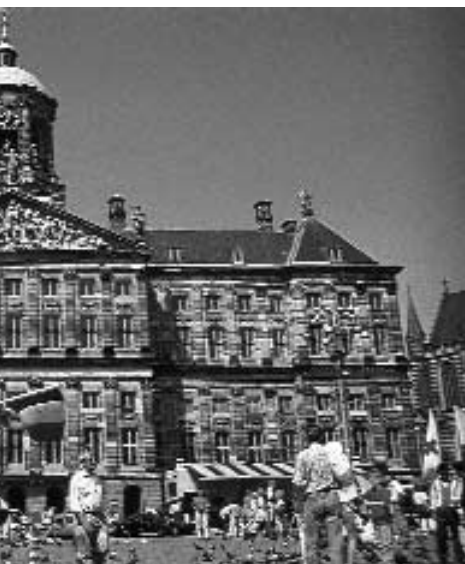
The Royal Palace at the Dam in Amsterdam

Beatrix welcomed her guests among 1,000 wax-candle lights and daffodils. She treated them to string-band music by, among others, Armando. In the evening the assembled party attended a ballet gala in the Music Theater by the Dutch Dancing Theater and the National Ballet. The sovereign had hired the balcony for this regularly programmed performance. The 'common' folk were seated on the main floor of the auditorium.