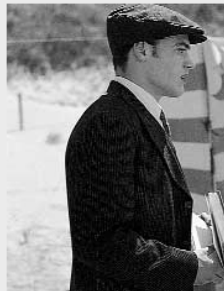
Scene uit Karakter