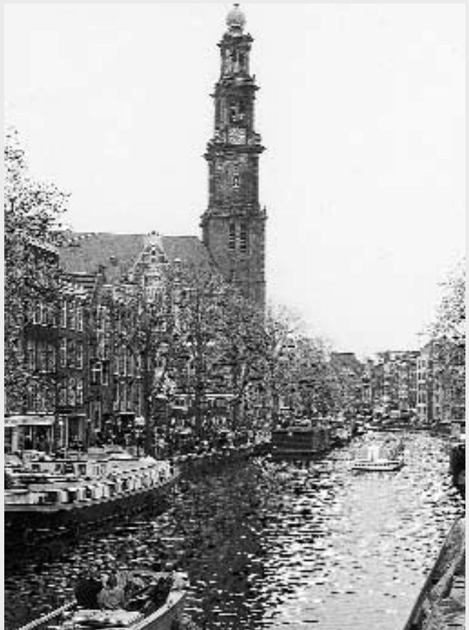
Het Anne Frank-huis aan de Prinsengracht

Het Anne Frankhuis in Amsterdam heeft vorig jaar een record van 710.543 bezoekers getrokken. Dat is ruim 13 procent meer dan in 1996. De Anne Frank Stichting schrijft de bezoekersstroom toe aan de stijging van het toerisme naar Amsterdam en de publiciteit over het dagboek van Anne Frank. Wegens het stijgend aantal bezoekers verruimt het Anne Frankhuis de openingstijden vanaf april tot september tot 21.00 uur.