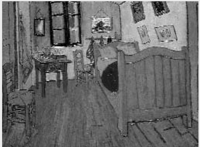
Vincent's slaapkamer in Arles (1888)

Het contact met de Kamer van Koophandel in Pella kwam tot stand dankzij een krantartikel dat vorig jaar over deze 'Hollandse nederzetting' verscheen. Na een fax en een belletje kreeg Daniëlle verrassend snel het aanbod om vijf maanden lang volwaardig mee te draaien. Ze zal worden betrokken bij de promotie in de regio van het genoemde 'Tulpenfestival', dat dit jaar op 7, 8 en 9 mei wordt gehouden en tienduizenden bezoekers trekt. Ook wordt ze ingeschakeld bij promotiebeurzen van Pella, te houden in Saint Louis, Chicago en Milwaukee en mag ze een open dag op touw zetten, waarbij het plaatselijke bedrijfsleven zich aan zijn 10.000 inwoners presenteert. Pella tracht via de contacten en studie van Daniëlle en passant voor elkaar te krijgen, dat het stadje een plaats krijgt op de Hollandse toeristenkaart. Getracht wordt Nederlanders via arrangementen naar de 'Bijbelse stad van Belofte' (de betekenis van Pella) te halen. Pella werd in 1847 gesticht door dominee Scholte; hij nam in zijn kielzog tal van voornamelijk gereformeerde emigranten uit Nederland mee. Het waren families die in Amerika niet alleen een nieuwe toekomst maar vooral geloofsvrijheid zochten.