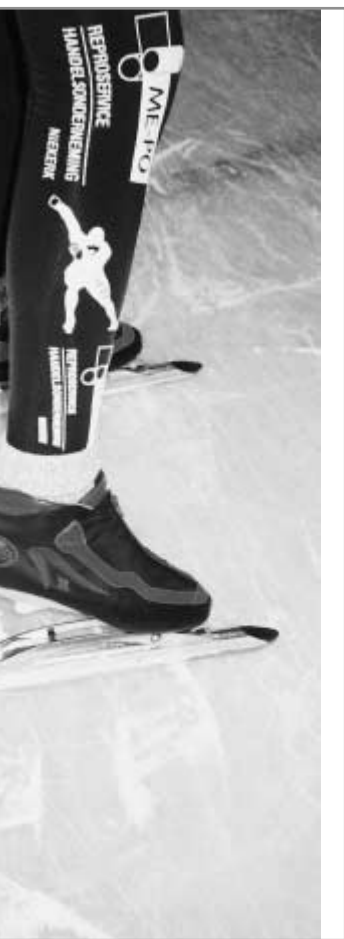
Page from 1st form maths text-book

Previous studies have shown that more than half of the number of Dutch students have respectively a neutral (32 per cent) and a positive (30) attitude towards Germany.