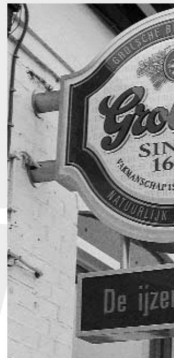
Uithangbord plaatselijk café met Grolsch "van de tap"

De varianten die het langst in de race bleven waren de concentratie met nieuwbouw in Enschede of Groenlo. De keuze viel uiteindelijk op De Grote Plooi vanwege de directe ligging aan en aansluiting op de A35. Daarnaast speelde de steeds krappere wordende arbeidsmarkt een rol, alsmede de ligging aan de rand van een grote stad met z'n brede voorzieningenpakket - van universiteit tot schouwburg. Ook het woon-werkverkeer is meegewogen: zeventig procent van de 950 personeelsleden woont namelijk in Enschede of directe omgeving.