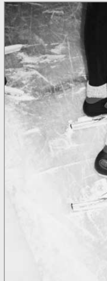
Pagina uit eersteklas wiskundeboek

Duits op school is steeds minder populair. Het percentage leerlingen dat de taal kiest als examenvak loopt terug. Negatieve beelden van Duitsland spelen daarbij overigens geen rol. Dat leert een onderzoek door de Universiteit Nijmegen en de Stichting Platform Duitsland. De afnemende belangstelling voor Duits geldt voor vrijwel alle schooltypen in het voortgezet onderwijs. Bij het vbo is de belangstelling weliswaar constant gebleven, maar het percentage leerlingen dat kiest voor Duits ligt er ook veel lager dan bij andere opleidingen: 19 tegen respectievelijk 49, 37 en 43 procent voor mavo, havo en vwo. Wiskunde en economie zijn meer geliefd dan Duits, ook al neemt de populariteit van economie af. Wiskunde en aardrijkskunde mogen zich de afgelopen vier jaar verheugen in een toenemende belangstelling. Naast Duits boet ook Frans in aan interesse. Schoolleiders geven als verklaring voor de terugloop bij Duits de concurrentie met andere vakken en het feit dat het vak als moeilijk wordt ervaren. Het zogeheten Duitsland-beeld is volgens slechts zeven procent van de schoolleiders en 17 procent van de docenten Duits van invloed op het keuzegedrag van leerlingen. Eerder onderzoek heeft uitgewezen dat meer dan de helft van de Nederlandse leerlingen een neutrale (32 procent) dan wel positieve (30) houding heeft ten aanzien van Duitsland.