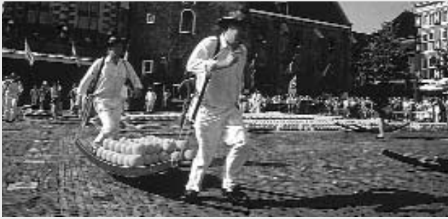
Kaasdragers op kaasmarkt in Alkmaar