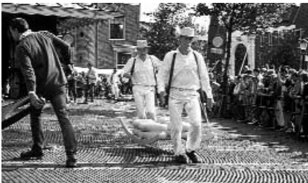
Cheese-carriers at Alkmaar Market

Even in 1995, more than 100,000 tons went to countries outside the European Union; last year that was 82,300 tons. That drop resulted from the lower subsidies granted by the European Commission. Only Russia appeared to be a bigger customer. Stagnant exports had no effect on the level of price quotations in Leeuwarden. In 1997, they started at HFL 5.60 for a kilogram of Gouda and stopped at HFL 6.25. For Edam, even an additional twenty cents a kilogram was paid. The quotation for butter rose even more dramatically: from HFL 6.80 a kilo to HFL 7.80 at the end of the year.