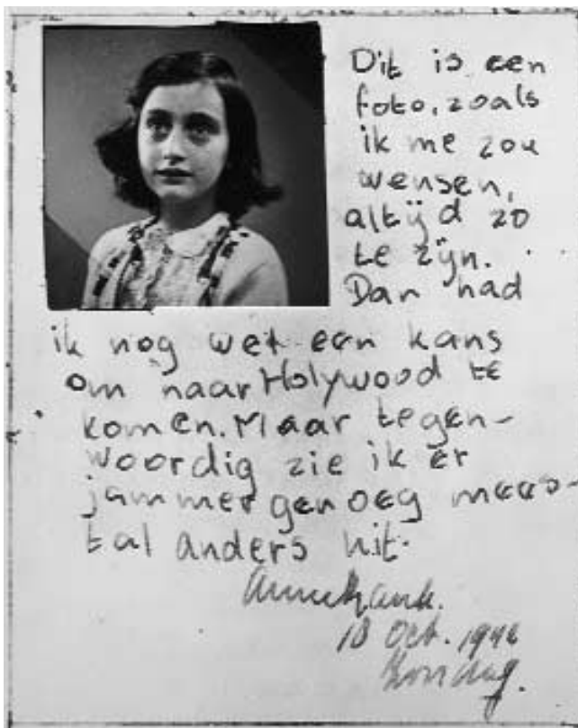
Famous page from Anne Frank Diary

The Anne Frank House in Amsterdam has attracted a record number of 710,543 visitors last year. That is over 13 per cent more than in 1996. The Anne Frank Foundation attributes the stream of visitors to the rise of tourism in Amsterdam and the publicity about the diary of Anne Frank. Due to the rising number of visitors, the Anne Frank House will extend opening hours until 21.00 hours from April to September.