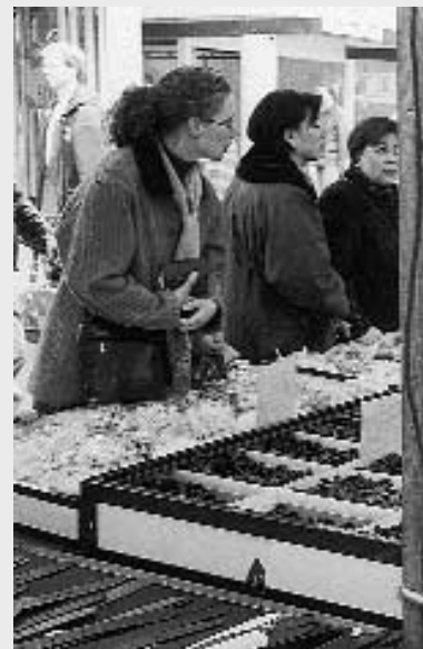
Dropverkoop op Utrechter markt

markt, waar hij zijn koffie meestal vandaan haalt, nauwelijks na over zijn keuze. Uit observaties is gebleken dat 80 procent van de consumenten in minder dan 15 seconden heel instinctmatig zijn koffie uit het schap pakt.