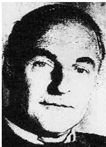
Jaap ter Haar (1923-1998)

"I am just a craftsman". If Jaap ter Haar, who died in his place of residence Laren on Thursday, hated anything, it was boasting about his authorship. He looked down on 'complicated and cultural fuss'. "I have never pretended being an artist. Life is so much more important than art. I am a craftsman, that's all. I learnt the trade while writing. When you re-read my first booklets, my goodness! Nothing but commonplaces!"