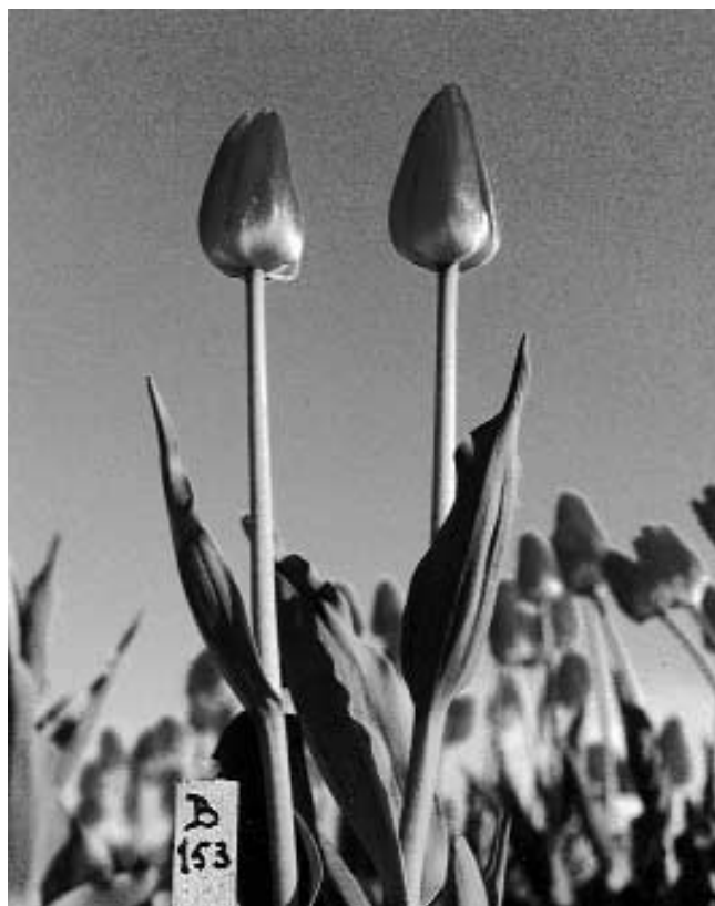
New tulip species: "Dokkum" (previously named R.Z.B. 153)

Lowlands will make yet another excursion during the tour, that is, to the town of Greenbay, Wisconsin. Here the Dutchmen will organize a conference that should be the initial step towards further cooperation; after the example of Holland, Michigan.