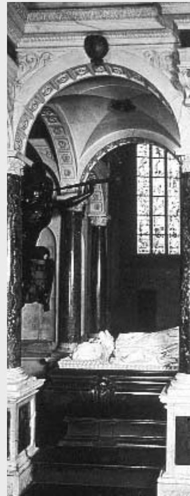
Crypte van Willem van Oranje

Over drie aanwezige lijkkasten bestaat geen zekerheid. In de buurt van de rustplaatsen van Willem van Oranje en Louise de Coligny staan drie kisten met kinderen, van wie de identiteit niet vaststaat.